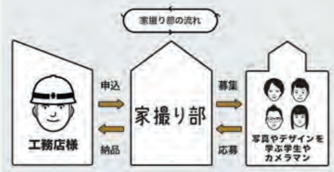
「工務店-アマチュアカメラマン-施主」がウィン・ウィンの関係になれるのが家撮り部のサービス。

「家撮り部」では、工務店さんやリフォーム会社さんが自社サイトなどで紹介する「施工写真」を撮影しています。ただし、基本的にプロのカメラマンが撮るのではなく、建築や写真を勉強している学生やアマチュアのカメラマンにより撮影するのが大きな特徴です。アマチュアのカメラマンは建築写真に興味があっても、なかなか実際の家を撮る機会がありません。一方、工務店さんなどは、自社の施工写真を撮影するのに大きいコストを捻出してプロのカメラマンに依頼するしかなく、現実的には、クオリティ面を妥協して自分たちで撮っている場合が多いようです。その間を埋めるサービスで、両者の想いをリンクさせた形が「家撮り部」。アマチュアのカメラマンは謝礼をもらいながら建築写真を勉強できて、工務店さんは安価で質の高い写真を得られるわけです。建築写真に特化しているサービスは他にもありますが、アマ