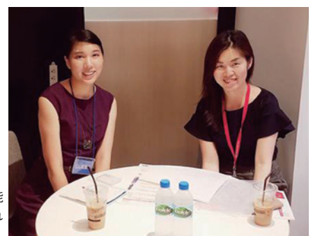
スタッフは全員女性。「気配りができる有能な人材が集まってくれました」と山川社長

起業してわかったのですが、経営者は自分で判断すべきことが多く、常に悩みや不安と対峙している孤独な存在です。そういった意味で、私にとって起業とは自分がチャレンジすると決めたことに対して戦っていく側面が強いですが、起業した当初の信念を忘れず、ひたすらに努力し継続していれば、手を差し伸べて一緒に戦ってくれる人、また取り組んできてくれたことを評価してくれる人、いろんな人が起業信念を支えてくれることになるはず。孤独な中でも光は差し、大きな学びや喜びとなって自分を成長させてくれると思いますよ。